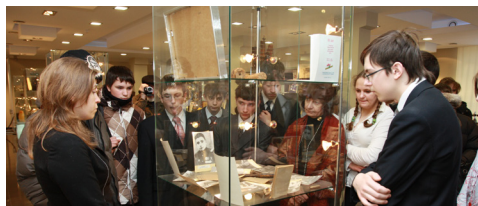
в «Музее истории газовой науки и технологий»