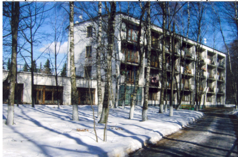
Здание бывшего профилактория ВНИИГАЗа

Тысячи сотрудников ВНИИГАЗа и других предприятий Газпрома сохранили о нашем профилактории самые теплые воспоминания.