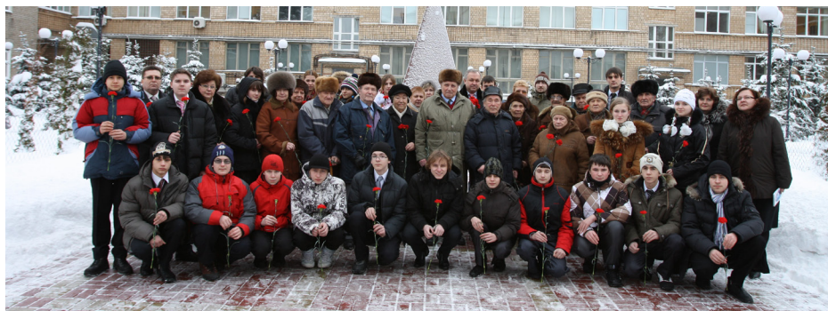
Встреча ветеранов Великой Отечественной войны-бывших сотрудников института и школьников на Аллее Славы в ООО «Газпром ВНИИГАЗ»

Аллея Славы в знак памяти о ветеранах нашего института.