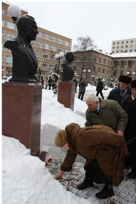
Возложение цветов на Аллее Славы 2 февраля 2010 года