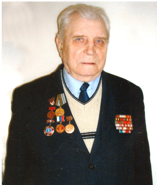
Николай Анисимович Лактионов